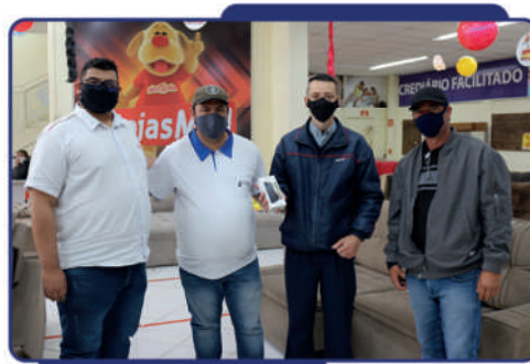
- Primeiro lugar ganhou celular cedido pelas Lojas MM

A iniciativa visou valorizar e homenagear os motoristas pelo seu dia, além de proporcionar a integração e descontração dos participantes.