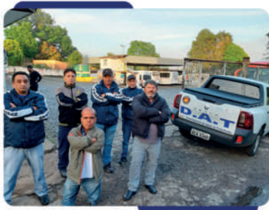
- Diretoria cruza os braços em sinal de protesto, em frente à Transpen

E m 2019, a empresa Transpen, de Jaguariaíva, surpreendeu os trabalhadores com um ofício informando a demissão de todos os cobradores. De imediato, o Sintropas emitiu uma nota se manifestando contrário às demissões sumárias e, no dia seguinte do comunicado, esteve em frente à empresa, bloqueando a saída dos veículos em sinal de protesto.