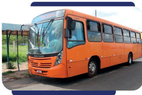
- Ônibus foi adquirido pela diretoria do Sintropas em agosto de 2020

Para participar, é necessário ser associado do Sintropas há pelo menos seis meses e ter Carteira Nacional de Habilitação (CNH) nas categorias D ou E. Os interessados devem efetuar as inscrições diretamente na sede do sindicato (rua Balduino Taques, 480 - Centro, no 3º andar do Edifício Itapoã).