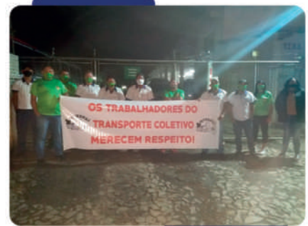
- Diretores do Sintropas em frente à VCC

A greve foi encerrada 14 dias depois, após atendidas as reivindicações da classe, por intermédio do Sintropas. Vale ressaltar que os trabalhadores não pagaram nenhum dia de greve e receberam os salários normais.