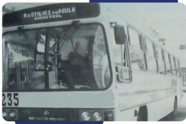
- Até 1991, os trabalhadores eram representados pelo Sitroponta