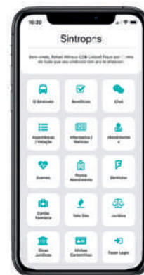
- O aplicativo está disponível para os sistemas Android e IOS

O acesso é liberado pelo Sintropas. Após a confirmação do sindicato, o associado já está liberado para usar todos os benefícios da entidade, através do próprio aparelho. No aplicativo também é possível conversar com a equipe do Sintropas-PG por meio do chat.